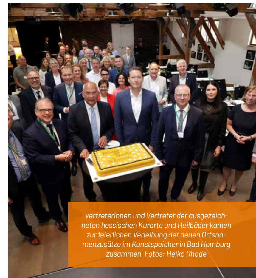
Vertreterinnen und Vertreter der ausgezeichneten hessischen Kurorte und Heilbäder kamen zur feierlichen Verleihung der neuen Ortsnamenzusätze im Kunstspeicher in Bad Homburg zusammen.

Für Bad Sooden-Allendorf steht die Bezeichnung damit nicht nur für Tradition, sondern auch für überprüfte Qualität. Der neue Ortsname macht diese besondere Stellung künftig bereits auf den ersten Blick sichtbar. (sw/red)