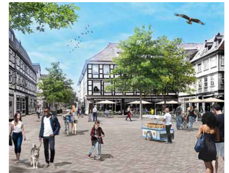
Belebt und einladend: Die Neugestaltung von Kornmarkt und Marientorstraße

Am Ende entsteht ein Bereich, der mehr kann als heute: ein Ort, der zum Einkaufen, Begegnen und Verweilen einlädt, der Veranstaltungen Raum gibt und der die Innenstadt als Ganzes stärkt. Schritt für Schritt wächst so ein Platz, der Tradition und Zukunft miteinander verbindet – und der für viele Jahre ein lebendiger Mittelpunkt Osterodes bleiben wird.