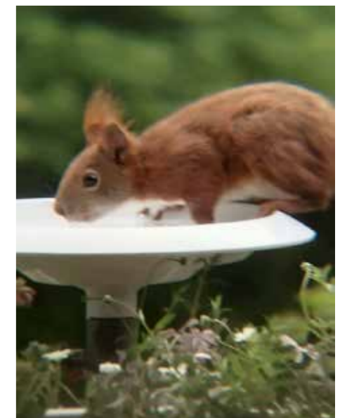
Das Eichhörnchen Pumuckel kommt regelmäßig vorbei.