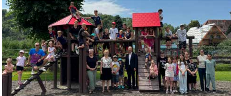
Die Freude der Schülerinnen und Schüler sprach bei der Einweihung für sich.

Herzberg-Scharzfeld – Mit strahlenden Gesichtern und spürbarer Begeisterung wurde am Freitag, 19. Juni 2026, auf dem Schulhof der Grundschule Scharzfeld ein neues Spielgerät offiziell eingeweiht. Zahlreiche Schülerinnen und Schüler, Lehrkräfte sowie Unterstützerinnen und Unterstützer waren gekommen, um diesen besonderen Moment gemeinsam zu feiern.