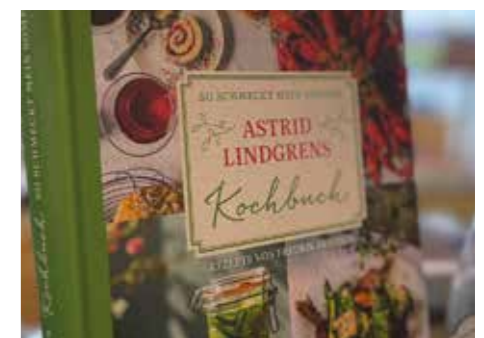
Der Buchladen „Die Bücherkiste“ in Hattorf am Harz bietet ein breites Sortiment von Büchern, Schulbedarf bis zu tollen Geschenkideen.

Nicht selten entwickelt sich daraus mehr. „Manchmal sind wir auch ein bisschen Seelsorger“, sagt sie. Es sind diese Momente, die zeigen, wie tief die Buchhandlung im Alltag der Menschen verankert ist.