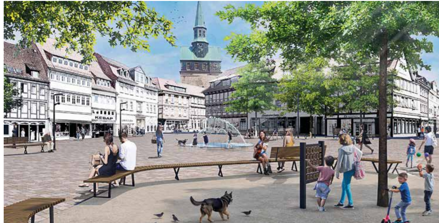
Blick über den neu gestalteten Kornmarkt: Historischer Charme trifft auf moderne Elemente.