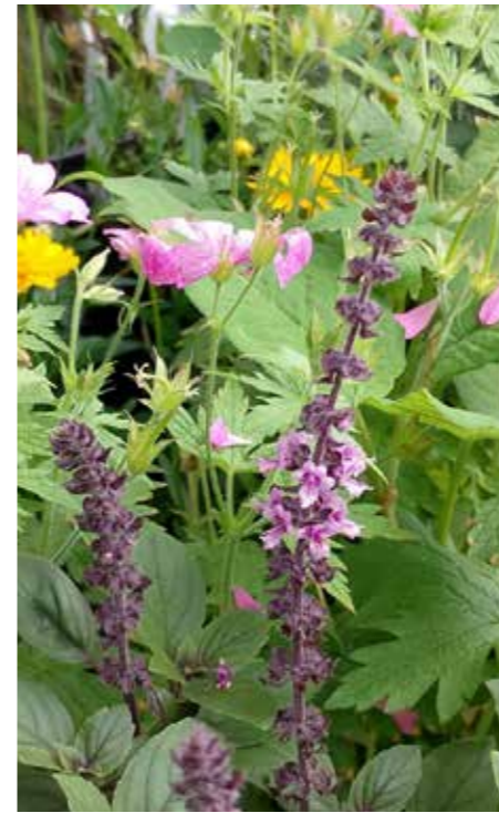
Die Vielfalt der Pflanzen ist zuhause zahlreicher Bienen und anderer Insekten.