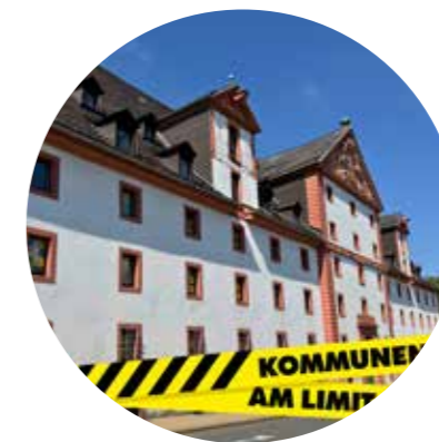
Die Stadt Osterode am Harz macht mit Plakaten in den Fenstern des Rathauses auf den Aktionstag aufmerksam.

O sterode/Region. Mit dem bundesweiten Aktionstag „Kommunen am Limit“ haben Städte, Landkreise und Gemeinden am 22. Juni auf ihre dramatische Finanzlage aufmerksam gemacht. Die kommunalen Spitzenverbände fordern von Bund und Ländern entschiedenes Handeln gegen die wachsende Krise. Hintergrund ist ein Rekorddefizit von rund 30 Milliarden Euro im Jahr 2025. Haupttreiber sind steigende Sozialausgaben, deren Umfang und Standards stetig erhöht wurden. Die Folgen zeigen sich längst vor Ort: Investitionen in