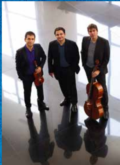
17.5.2026 Zwei Riesen im Dialog G.A.P. Ensemble Muthaus, Burg Hardeg Hardeggen