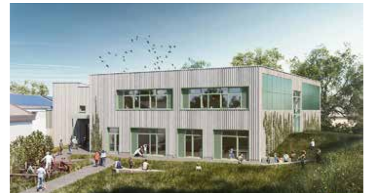
Erweiterung und energetische Sanierung der Regenbogenschule im Ortsteil Elliehausen. Foto: Hegger-Hegger-Schleiff Architekten

Der Erweiterungsbau umfasst 1.640 Quadratmeter Geschossfläche und kostete rund neun Millionen Euro. Gefördert wurde er über das Investitionsprogramm „Ganztagsausbau“ von Bund und Ländern.