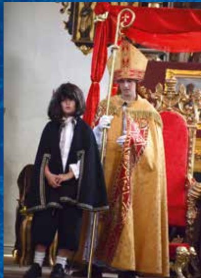
16.5.2026 London Dreams Kindermusical St. Jacobi-Schlosskirche Osterode am Harz