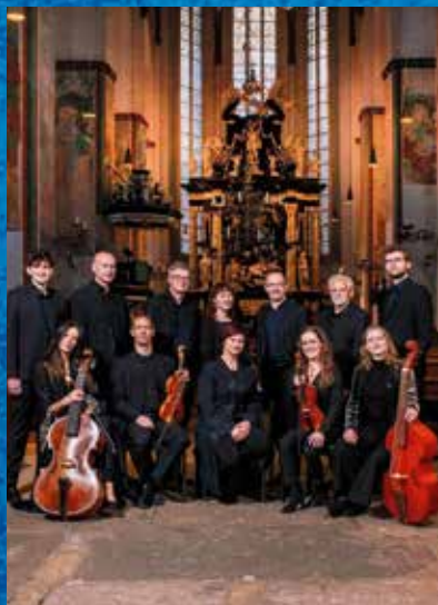
24.5.2026 Ein Feste Burg Europ. Hanse-Ensemble Welfenschloss Hann. Münden