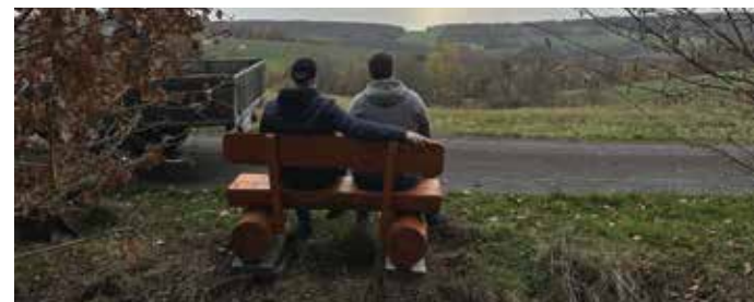
Aus Escherode, für Escherode: Über die Dorfmoderator*innen beantragt – als Sitzbank schnell umgesetzt.

Sie haben eine Idee, die Ihr Dorf oder Ihren Stadtteil voranbringt? Ob Bank am Spielplatz, Aktionstag im Stadtteil oder digitales Nachbarschaftsnetzwerk: Mit dem Dorf- und Quartiersbudget unterstützen wir als Landkreis Göttingen Ihr Engagement dort, wo es zählt – direkt vor Ort, schnell und unbürokratisch. Dafür stellt der Kreistag jährlich 40.000 Euro bereit. Im Dorfbudget können kleinere Vorhaben in den Dörfern mit bis zu 500 Euro je Dorf gefördert werden. Für Stadtteile in den Grund- und Mittelzentren gibt es zusätzlich das Quartiersbudget: Insgesamt stehen hier 20 Budgets à 500 Euro be-