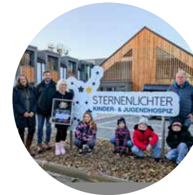
Checkübergabe mit Herz vor dem Kinder- und Jugendhospiz Göttingen.

Eine besondere Weihnachtsauführung zog am vierten Advent zahlreiche Besucherinnen und Besucher nach Lippoldshausen: Im Kuhstall der Familie Schmahl erzählten Kinder und Jugendliche die Weihnachtsgeschichte – mitten unter Kühen und Ziegen. Das große Interesse machte zwei Aufführungen nötig, die insgesamt rund 500 Menschen erlebten. 20 Kinder und Jugendliche spielten unter der Regie ihrer Mütter die biblischen Rollen. Mit stimmungsvoller Musik, einer liebevoll gestalteten Kulisse und großem ehrenamtlichem