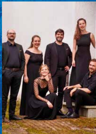
25.5.2026 Seeds of Sorrow Tempera Mente St. Norbert-Kirche Friedland