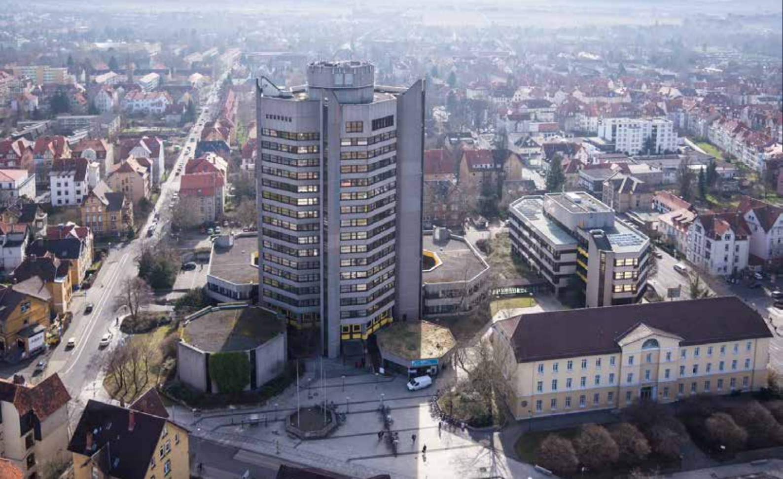
Im September geht es bei der Kommunalwahl um den Oberbürgermeisterposten im Neuen Rathaus Göttingen.