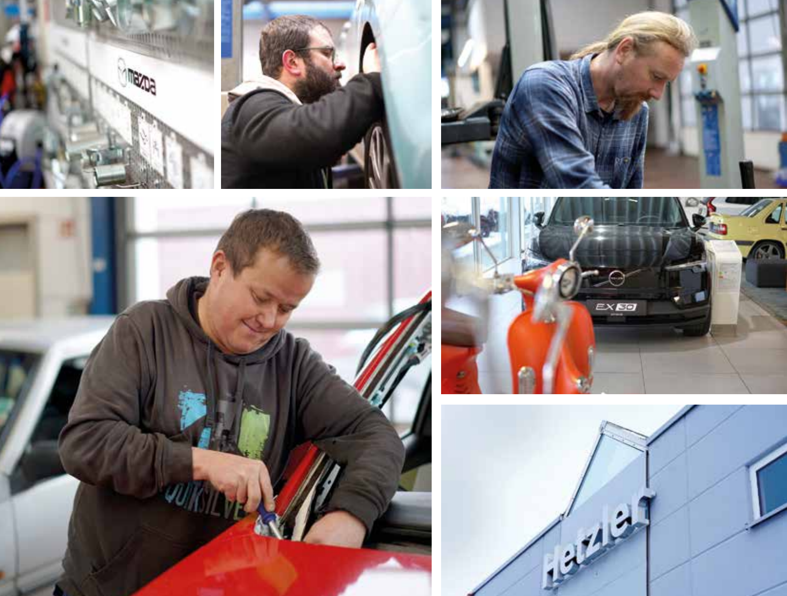
Einblick in die Werkstatt von Hetzler Automobile in Göttingen-Grone, Hans-Böckler-Straße 29.