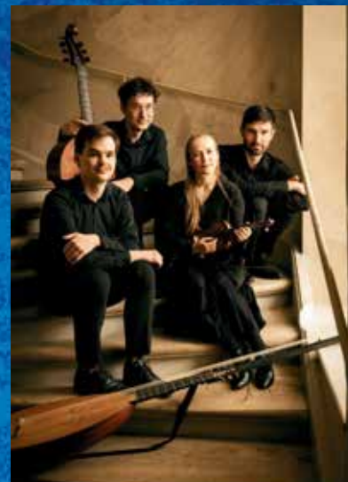
19.5.2026 Il Sassone False Consonance PS.SPEICHER Einbeck