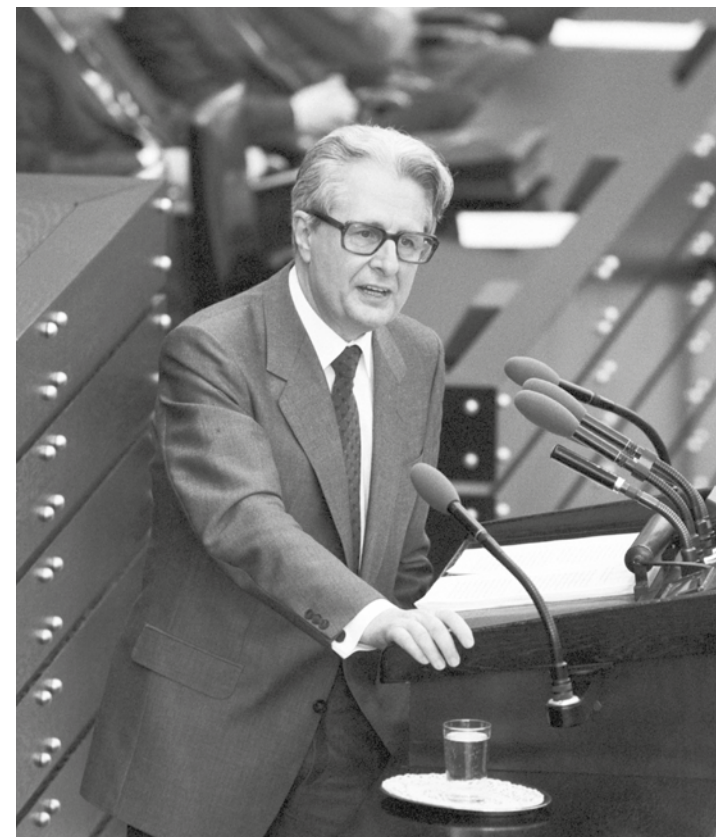
Hans-Jochen Vogel als „gefürchteter“ Redner im Deutschen Bundestag.