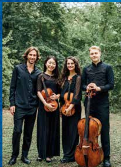
21.5.2026 Grenzgänger Il Parrasio Rathaus Duderstadt