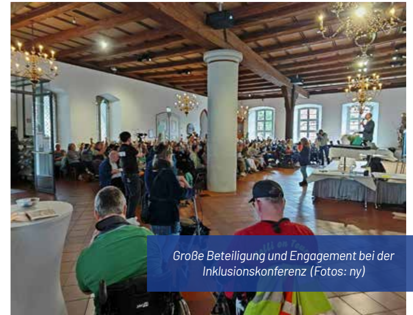
Große Beteiligung und Engagement bei der Inklusionskonferenz