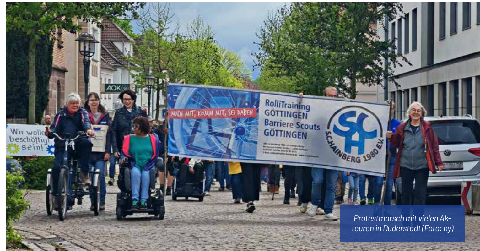
Protestmarsch mit vielen Akteuren in Duderstadt

Der Europäische Protesttag zur Gleichstellung für Menschen mit Behinderung stand 2026 unter dem Motto „Menschenrechte sind nicht verhandelbar“. In Duderstadt organisierte die Initiative „Inklusion bewegen“ des Landkreises Göttingen in Kooperation mit der Aktion Mensch Anfang Mai einen Protestmarsch für mehr Toleranz, Akzeptanz und Barrierefreiheit. Mit dabei waren zahlreiche Institutionen und Wohlfahrtsverbände, darunter die Caritas Südniedersachsen, die Lebenshilfe Eichsfeld, die Harz-Weser-Werke, die AWO, die Malteser und weitere, sowie Betroffene und Angehörige.