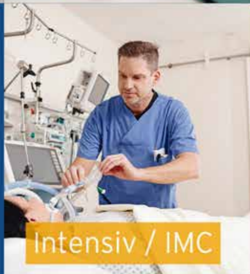
Intensiv / IMC