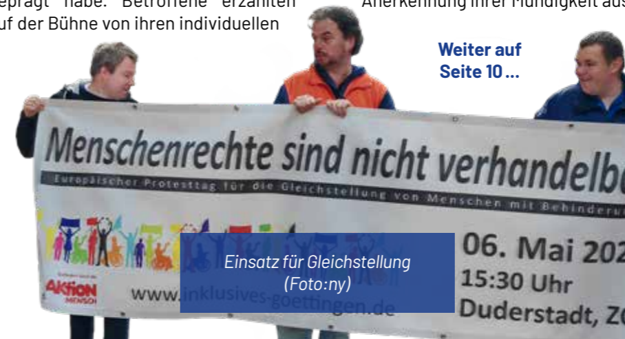
Einsatz für Gleichstellung