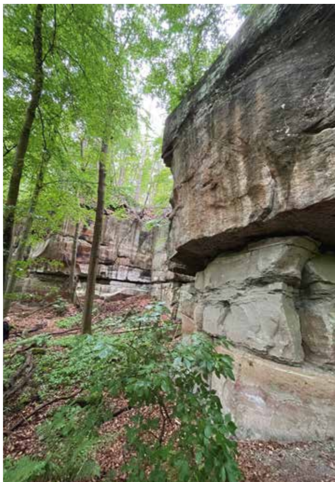
Jägersteine, Schattenwand und Hurkutstein sind nur eins von zahlreichen touristischen Zielen im Landkreis Göttingen: Riesige Sandsteinformationen, sogenannte Bielsteine prägen die Landschaft rund um Gleichen.

Weitere Infos zur Vortragsreihe und Termine finden Sie unter: www.landkreisgoettingen.de/VortragsreiheSchutz