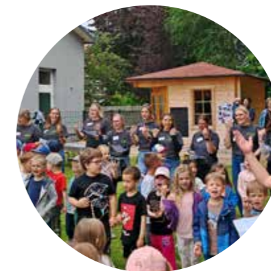
Mit Musik wird die Zwergenwerkstatt eingeweiht

Beim Sommerfest 2026 am Inklusiven Campus der Caritas Südniedersachsen in Duderstadt wurde das Werkhäuschen im Garten der Kita für Alle eingeweiht. Unter fachlicher Anleitung können die jungen Bastler nun eigene Ideen und Projekte in der „Zwergenwerkstatt“ umsetzen und dabei spielerische Einblicke ins Handwerk erlangen. Zur Begrüßung der zahlreichen Gäste präsentierten die Kinder einige Lieder zum Mitsingen. „Drei Jahre hat es gedauert, bis aus der Idee Realität geworden ist“, sag-