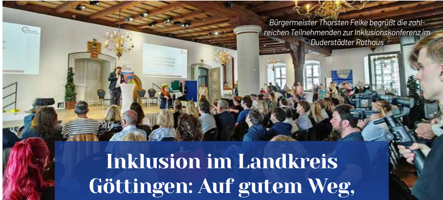
Bürgermeister Thorsten Feike begrüßt die zahlreichen Teilnehmenden zur Inklusionskonferenz im Duderstädter Rathaus