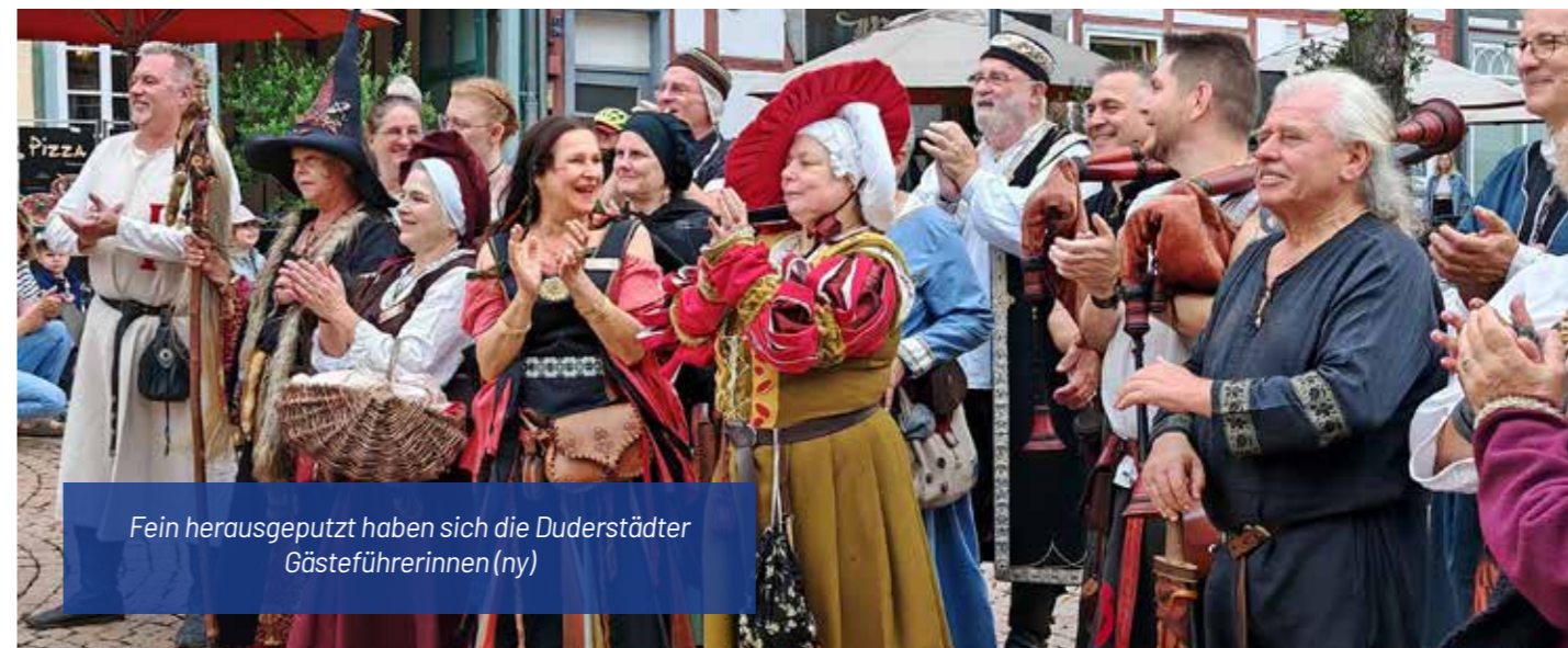
Fein herausgeputzt haben sich die Duderstädter Gästeführerinnen (ny)